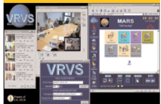
FIG. 3: PANTALLA DE VRVS

Por último, sobre el uso de la red, hay que decir que ésta debe servir para la investigación, pero que en determinados casos y con soluciones de compromiso que protejan el funcionamiento operativo normal, también se debe permitir usar la red para investigar en redes. Van a existir muchos problemas y en muchos casos confrontaciones, pero hay que intentarlo.