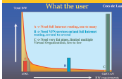
FIG. 2: USUARIOS SEGÚN CEES DE LAAT

muestra que el ancho de banda acumulado mayor es para el grupo C. En cualquier caso, sean los tipos de usuarios que sean, es necesario cubrir sus necesidades, pequeñas, medianas o grandes, aunque con el tipo de redes que disponemos, es lógico que se les intente sacar el máximo provecho y que aplicaciones que no funcionarían en otro tipo de redes puedan ser utilizadas por nuestros usuarios científicos.